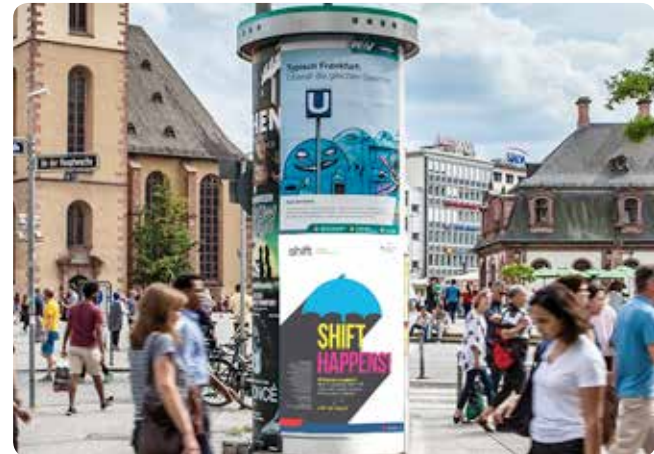
Wir platzieren Ihre Werbung auf den Hamburger Kultursäulen