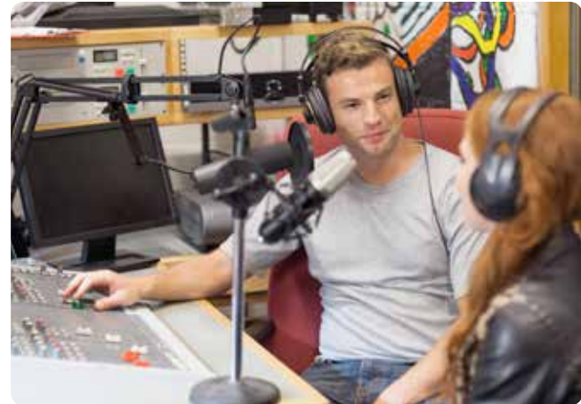
Wir platzieren Ihre Werbung im Radio