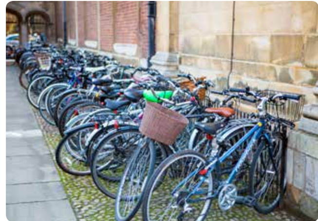
Wir platzieren Ihre Medien auf Tausenden von Fahrradsatteln